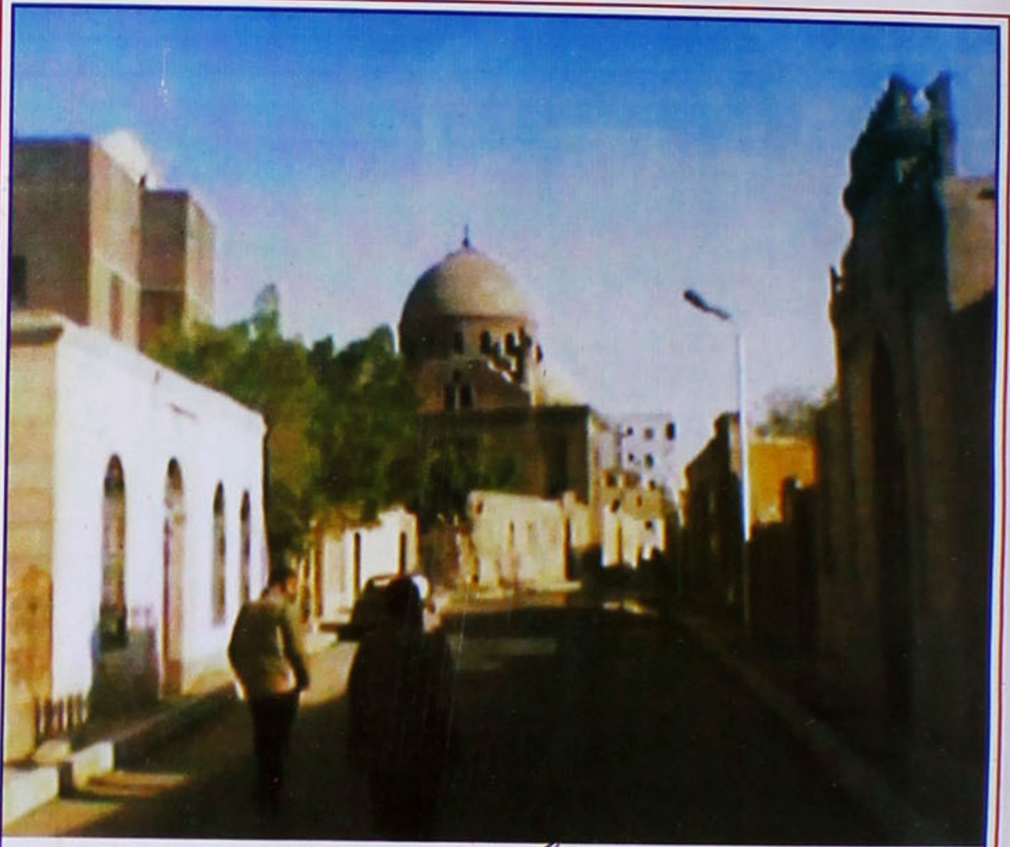
شارع عام سے گنبد کا ایک پروقار منظر