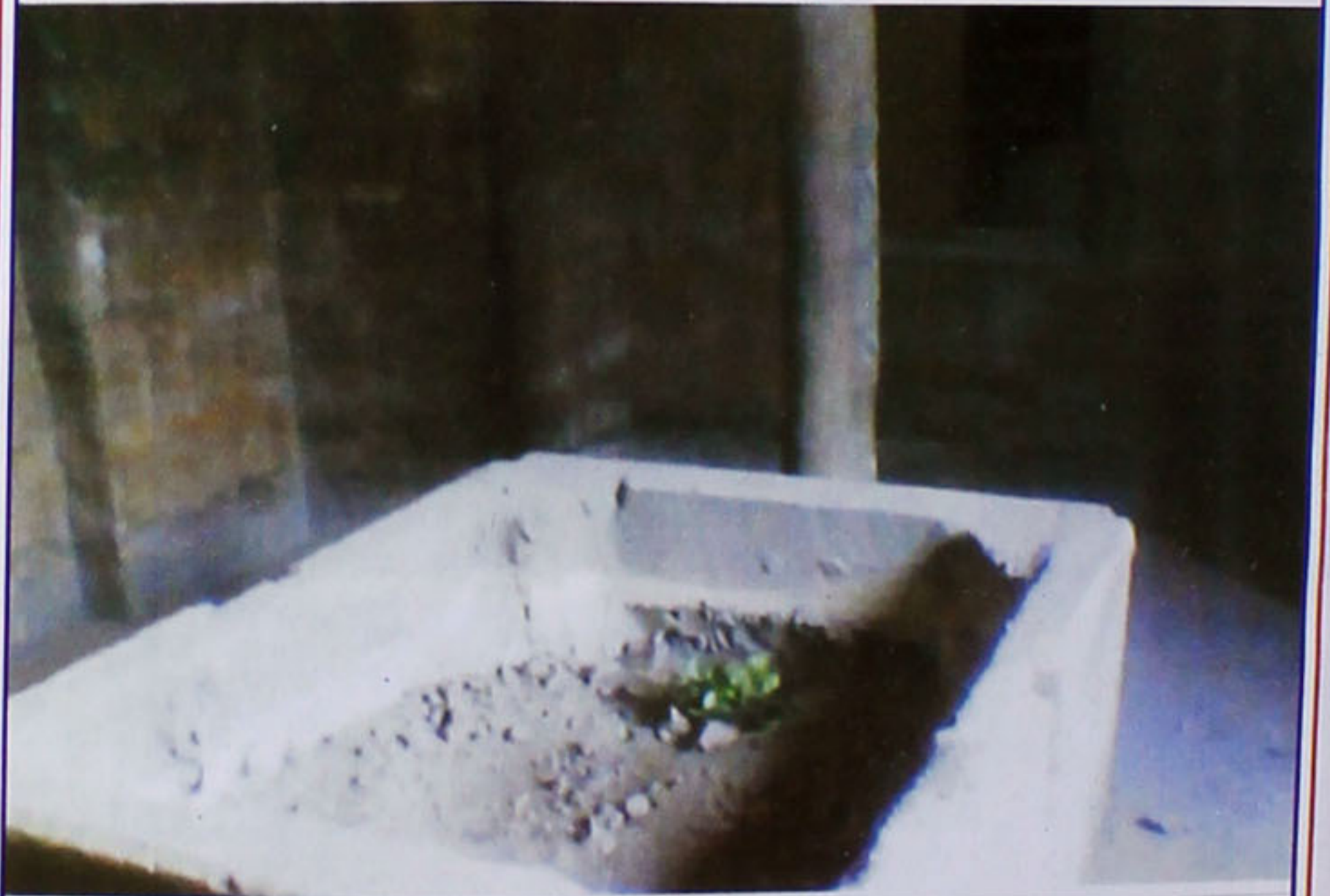
اندرون روضہ قبر اطہر کا ایک منظر