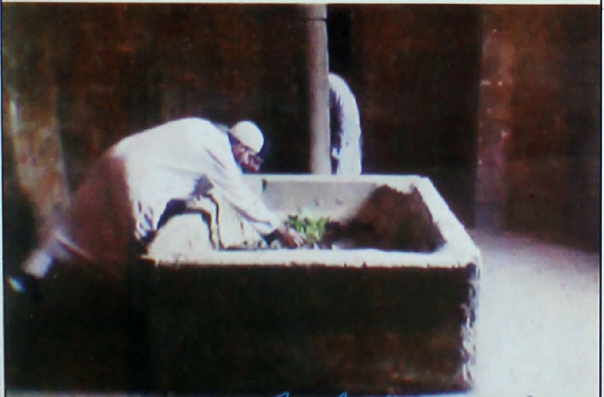
اندرون روضہ قبر النور کو مس کرتے ہوئے زائرین