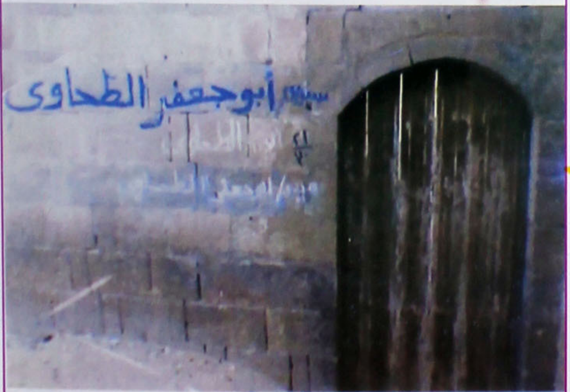
احاطہ مزار پر انوار کا ایک دروازہ