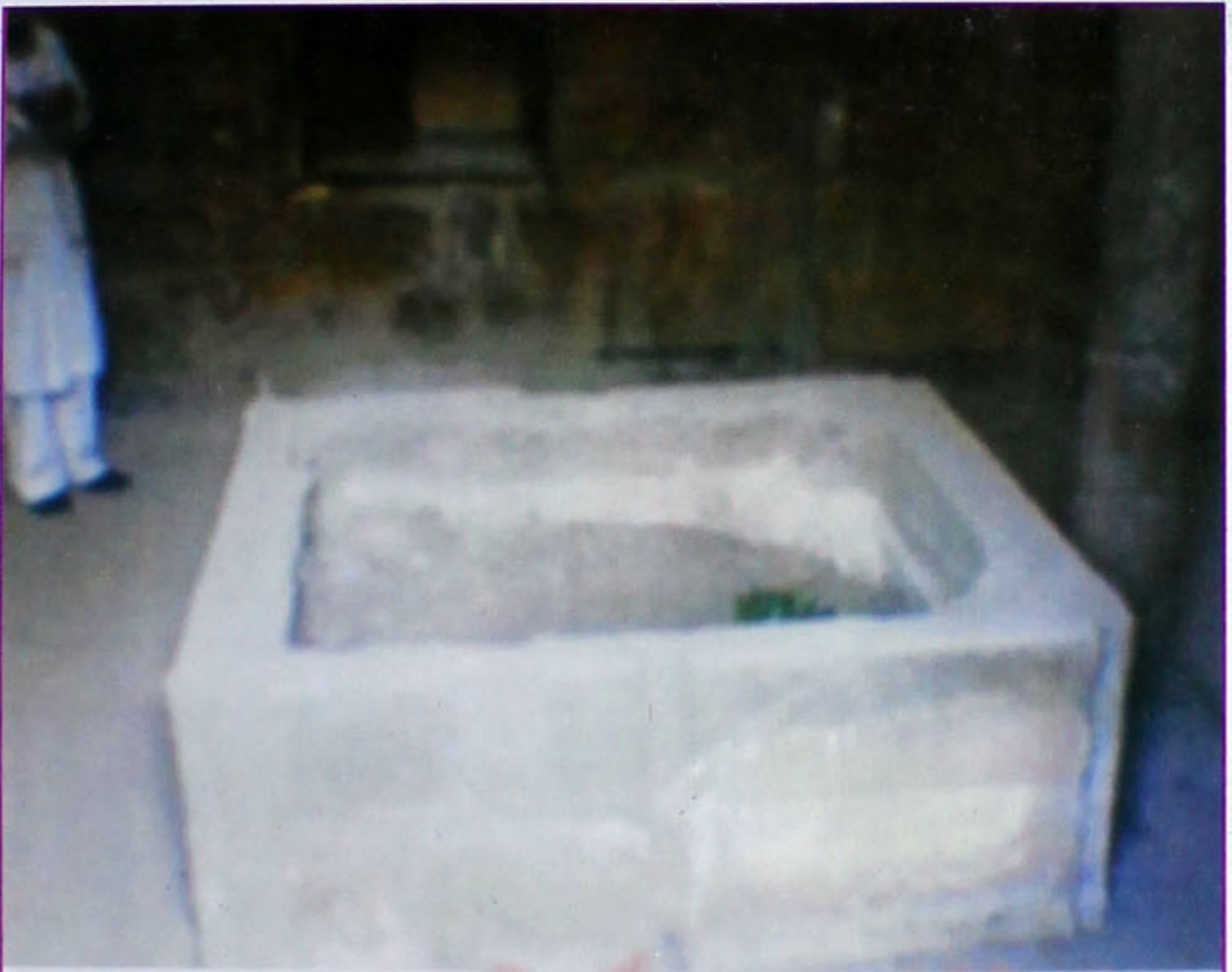
امام ابو جعفر طحاوی رضی اللہ تعالیٰ عنہ کی مرقد منوّر۔ قاہرہ مصر۔