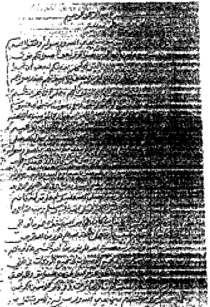
صورة الصفحة الأولى من المجلد الثامن نسخة « أ »