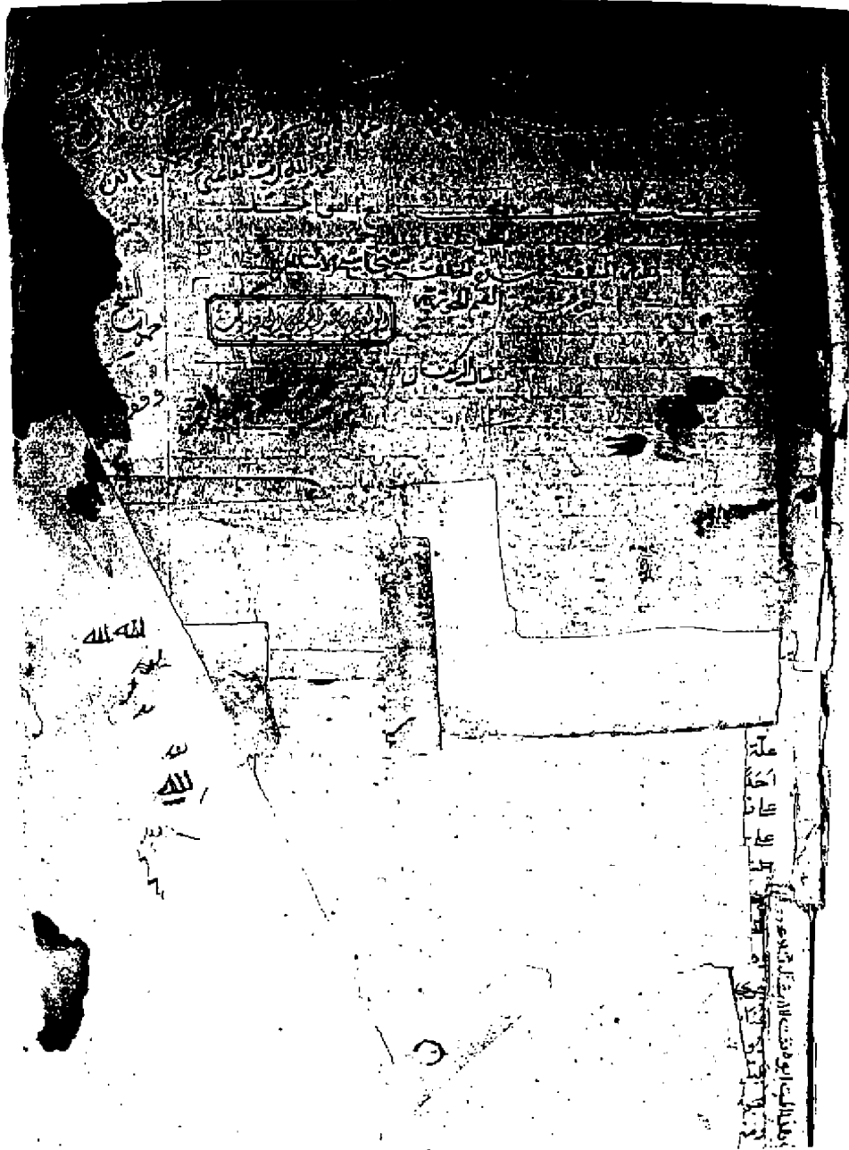
صفحة العنوان من النسخة النجدية (د)