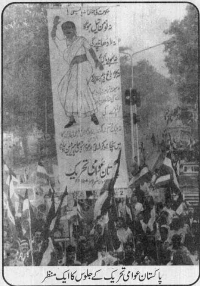
پاکستان عوامی تحریک کے جلوس کا ایک منظر