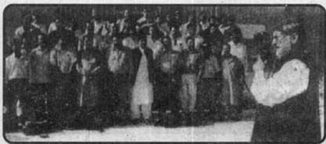
علامہ طاہر القادری پریس فونو گرافروں کی فونو کھینچتے ہوئے