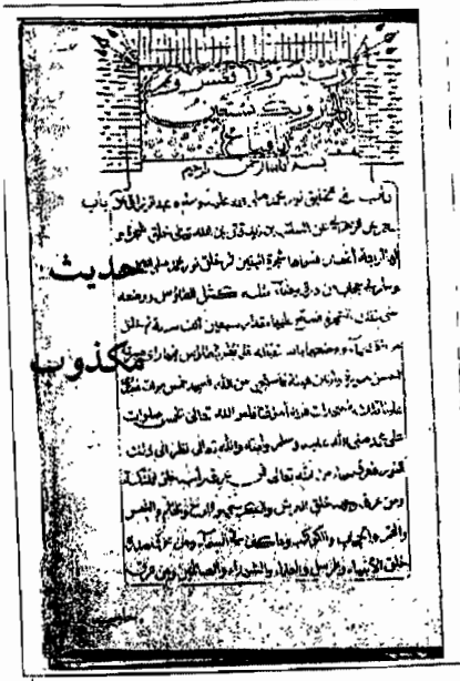
الصحة الأولى من المخطوطة